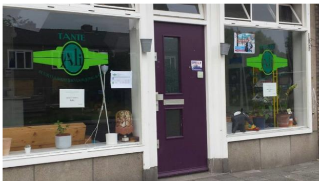
Buurthuiskamer Tante Ali , Burgemeester Vening Meineszlaan 185)