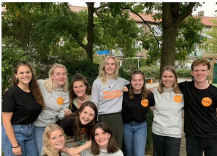
de studenten van VoorUit

Tot een paar jaar geleden stonden er meestal saaie, ijzere bouwhekken rondom gebouwen die gesloopt of vernieuwd werden. Nu zie je steeds vaker vrolijke hekken, bijvoorbeeld met plantenbakken of tekeningen van kinderen uit de buurt. Goed idee, dachten de studenten van VoorUit. De komende maanden gaan zij op pad, om verhalen en uitspraken op te halen bij bewoners. De leukste, mooiste of meest bijzondere zijn straks te zien op de bouwhekken in fase 1. Wie weet, staat jouw uitspraak er wel bij!