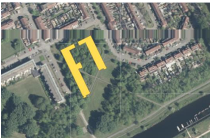
geplande locatie in het groen