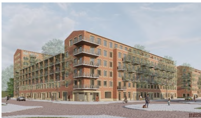
De Jacoba, het nieuwe gebouw op de hoek van de Hemsterhuisstraat en de Jacob Geelstraat

Er komen 90 koopwoningen in de nieuwbouw. De verkoop start waarschijnlijk na de zomervakantie. Wilt u meer weten over deze koopwoningen? Houd dan onze website in de gaten!