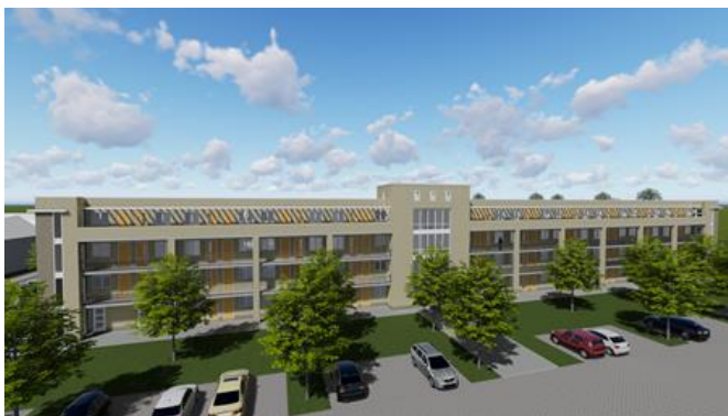
Artist impression nieuwbouw, vierlaagse (hoge) deel

Deze mijlpaal betekent dat we verder kunnen gaan met de voorbereidingen van dit project en de omgevingsvergunning kunnen aanvragen. Daarna moet de grond bouwrijp gemaakt worden. Als alle voorbereidingen spoedig verlopen, verwachten wij eind dit jaar of begin volgend jaar te kunnen starten met de bouw van de appartementen.