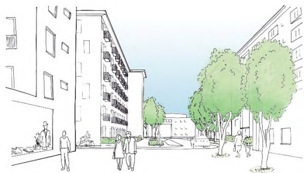
Schets van de nieuwe Nieuwenhuysenbuurt door bureau MUST

De gemeente heeft het stedenbouwkundig plan voor de nieuwe Nieuwenhuysenbuurt in mei ter inspraak gelegd. De bewonerscommissie heeft hierop gereageerd. Daarna is het plan op een paar punten aangepast. De gemeente heeft alle bewoners en omwonenden daar inmiddels over geïnformeerd. We verwachten dat het plan binnenkort door de gemeenteraad wordt vastgesteld.