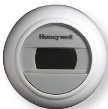
Voorbeeld van een kamerthermostaat

Er zijn ook programmeerbare kamerthermostaten (klokthermostaten). Daarmee kun je op vaste tijden een bepaalde temperatuur instellen.