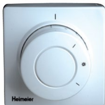
Voorbeeld van een centrale schakelaar ('nachtverlagingsschakelaar')

Vaak worden thermostatische radiatorcranen gecombineerd met een centrale schakelaar, ook wel nachtverlagingsschakelaar genoemd. Daarmee kun je de warmte van alle radiatoren in je woning in één keer regelen. Bijvoorbeeld 's avonds als je naar bed gaat en 's ochtends als je opstaat. Je hoeft dan niet alle radiatorcranen apart open of dicht te draaien.