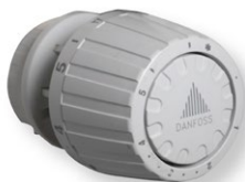
Voorbeeld van een thermostatische radiatorkraan

Hiermee kun je de temperatuur per vertrek regelen. Zijn er meer radiatoren in één vertrek, dan kun je het beste de cranen ervan op dezelfde stand zetten. Dat zorgt voor een gelijkmatige warmte.