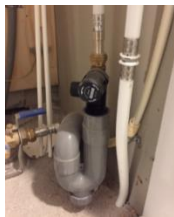
1. De syfoon

Sommige bewoners ervaren stankoverlast/rioollicht in de woning, dit kan voorkomen bij afvoeren die niet of nauwelijks in gebruik zijn en daarom droog gaan staan. Indien u water in de afvoeren giet tot aan de zwanenhals ontstaat er een waterslot en is het stankprobleem opgelost. Voor de stadswarmte afvoer kunt u dat doen door onderstaande instructie te volgen: