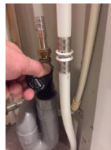
2. Bediening van het kraantje

Wij verwachten dat door bovenstaande omschreven actie de rioollucht snel verdwenen zal zijn.