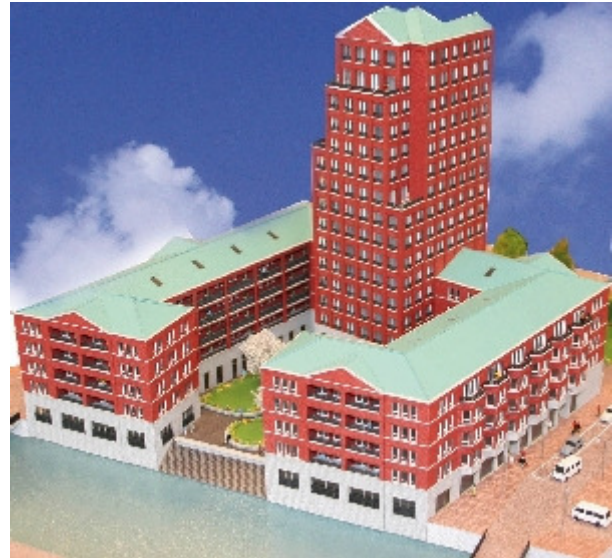
Afbeelding Het Caisson